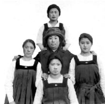
チュニツク姿の学生達に囲まれるトクヨ