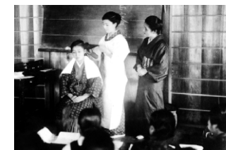
整容研究(山本 久栄)